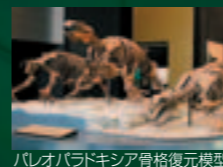
バロパロパドキシア骨格復元模型