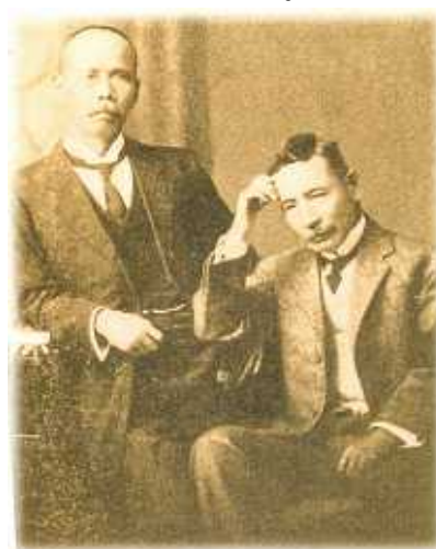
～中村是公と夏目漱石～