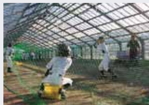
（バンビーズ専用室内練習場完備）